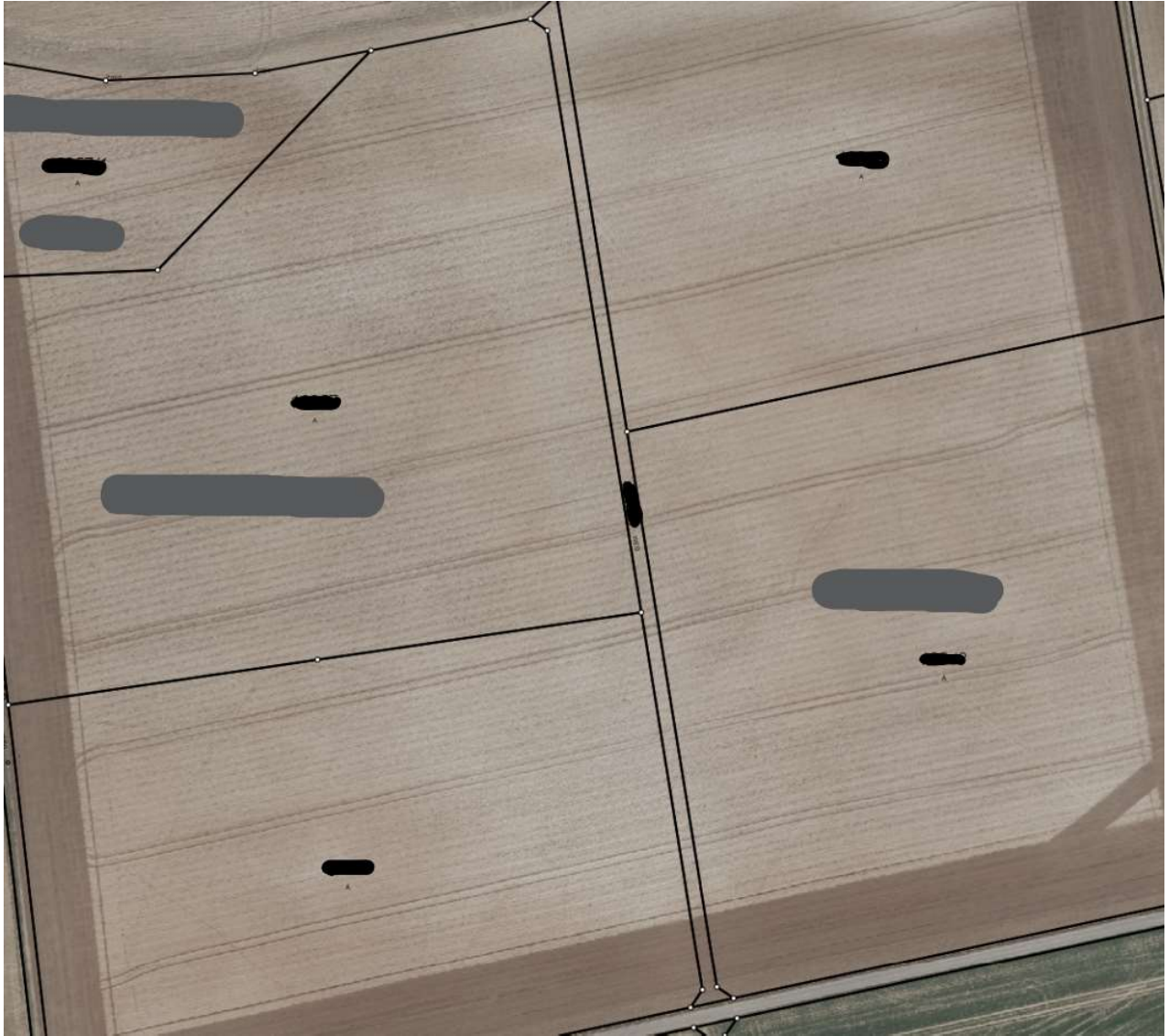
Abbildung 2 - Überackerter kommunaler Weg

Für diese Grundstücke bestehen keine Pachtverhältnisse.